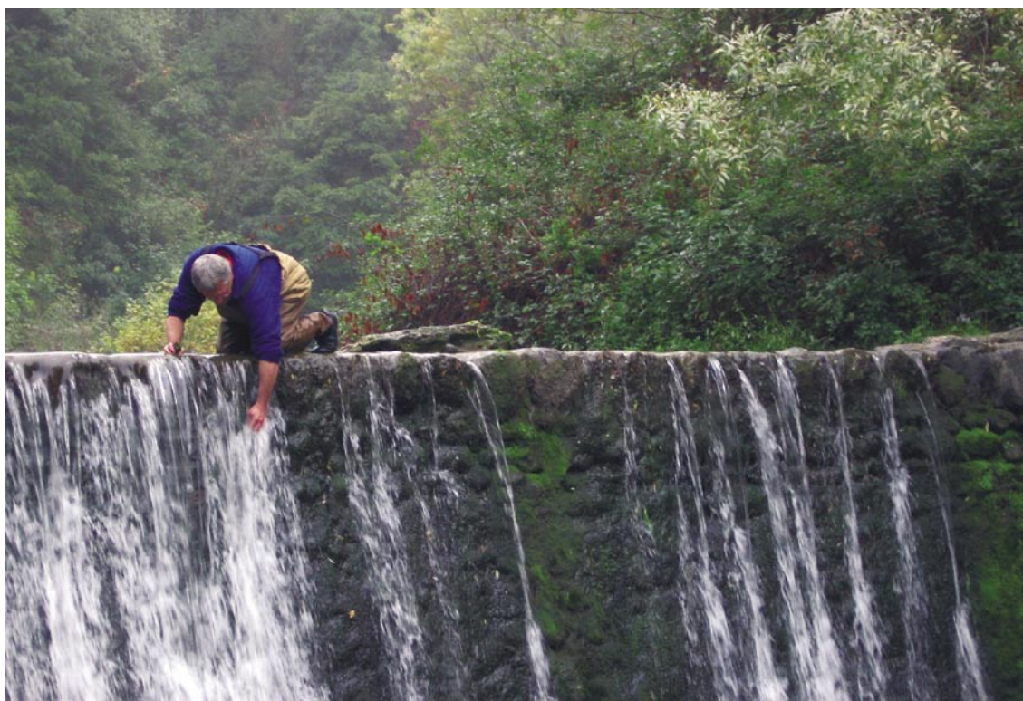
■ Prélèvement de bryophytes par un agent de la DIREN (indicateurs de la présence de métaux dans l'eau)